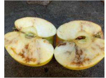
Pomme attaquée par des larves de céraatite

Les populations augmentent au fil de la saison. On observe des pics en juillet et en août. Des populations très importantes sont constatées fin septembre, période durant laquelle les punaises gagnent des refuges (hangars, maisons le plus souvent) pour y passer l'hiver.