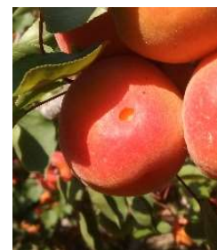
Attaque de forficule sur abricot

Les parcelles avec un enherbement haut, les arbres non protégés par un anneau de glu et les fruits présentant des noyaux fendus constituent les situations les plus à risque.