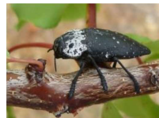
Capnode adulte

L'été sec et chaud lui procure de bonnes conditions de reproduction.