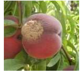
Symptôme de moniliose sur pêche

La meilleure stratégie reste l'encadrement de la floraison avec des insecticides. Les barrières physiques ne sont pas assez efficaces.