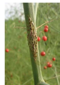
Rouille sur tige

Plusieurs cas sont observés à partir de juin. La pression persiste tout au long de l'été. Les stratégies de protection recommandées sont efficaces à condition d'être appliquées en prévention.