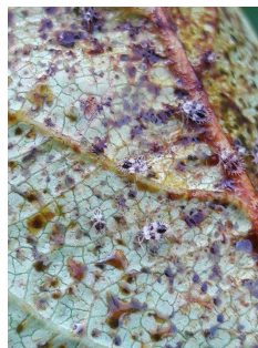
Face inférieure de feuille attaquée par des tigres du poirier (GRCETA BD)

Des attaques de tigre du poirier ( Stephanitis pyri ) sont aussi constatées sur feuilles, dans des vergers de pommiers biologiques, de fin juillet à septembre. Les attaques se manifestent par des feuilles apparaissant marbrées, de couleur blanc gris, dont la face inférieure est criblée de taches sombres (déjections). Les tigres se nourrissent en vidant les cellules de leur contenu. Ils sécrètent du miellat sur lequel se développe la fumagine. Les feuilles très atteintes finissent par chuter.