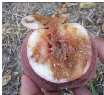
Pêche attaquée par des larves de cératite

Les pièges doivent être mis en place un mois et demi avant la maturité.