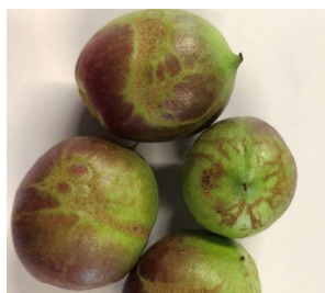
Symptôme de thrips meridionalis sur nectarines

La pression de Thrips meridionalis sur nectarines est forte cette année. L'encadrement de la floraison avec une barrière physique puis un insecticide reste indispensable et donne généralement de bons résultats.